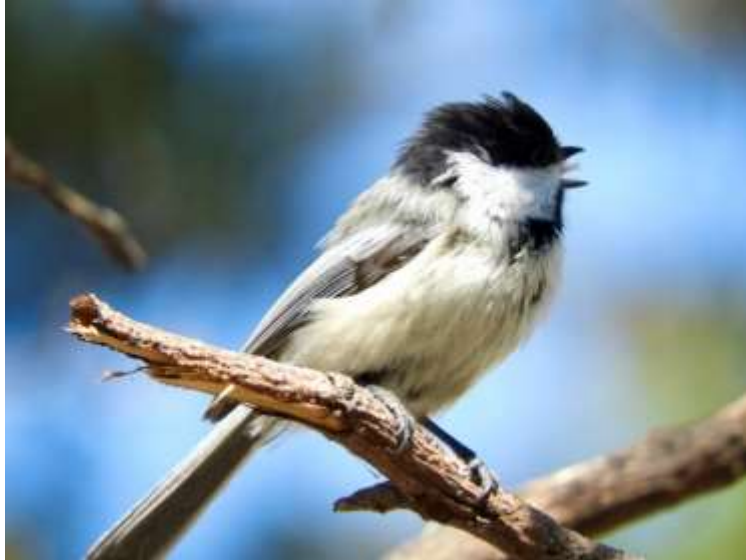
Chickadee, Dorothy Badry